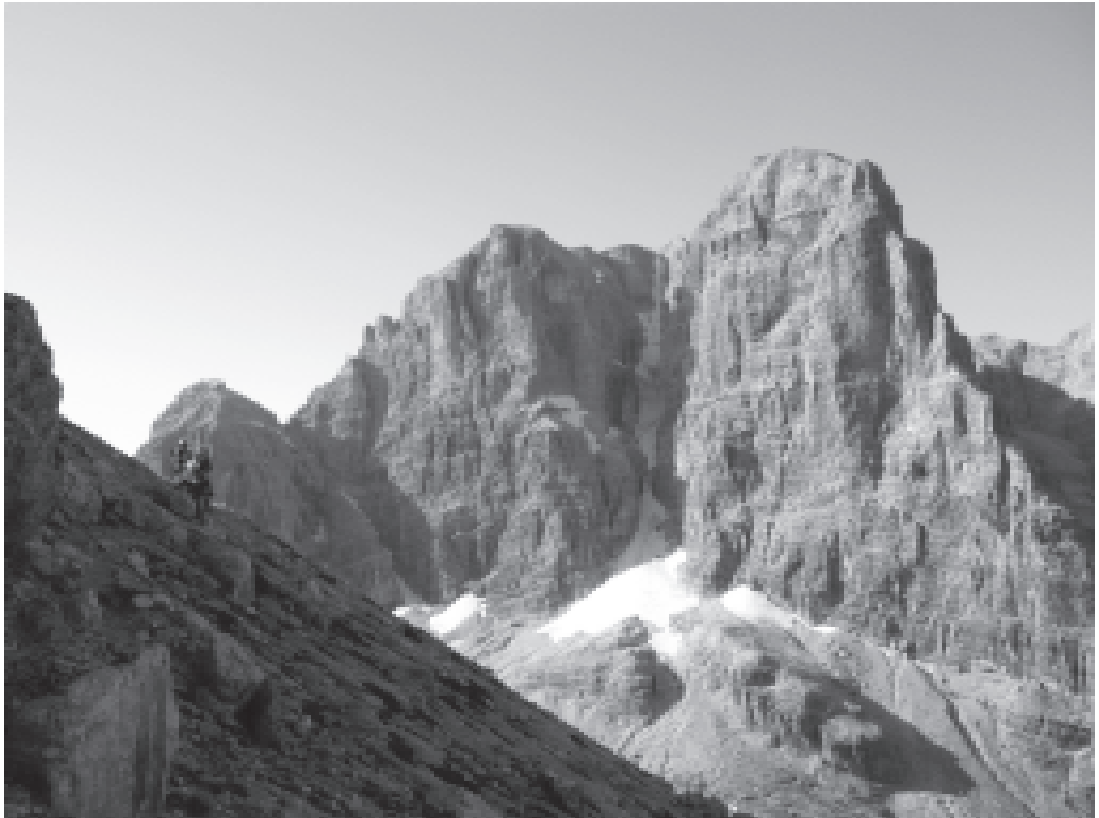
Crozzon di Brenta

Periodico della Sezione di Livorno del Club Alpino Italiano