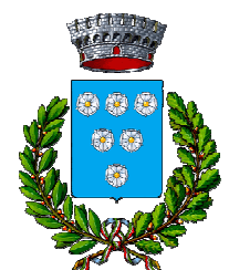
Comune di Rosignano M.mo