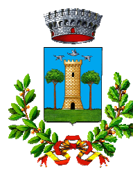
Comune di Collesalveti