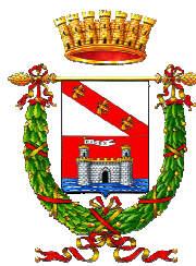
Provincia di Livorno