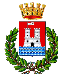
Comune di Livorno