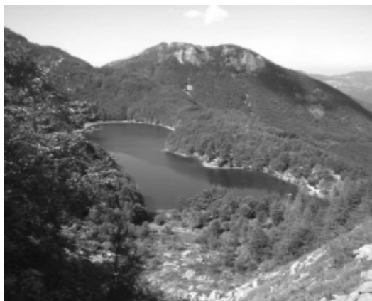
Lago Santo modenese