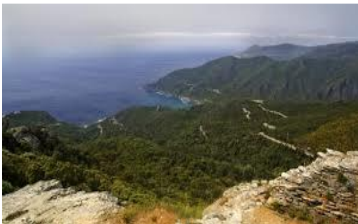
VISTA DEL DTO

Seneca è famoso nell'era classica per essere stato vittima di una congiura crudele, tantoché fu fatto suicidare da Nerone stesso (50dc), nonostante fosse stato un ottimo consigliere e guida (così che Nerone fu benvenuto dal popolo dell'antica Roma).