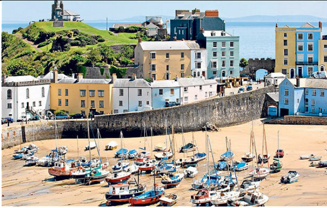
Tenby bassa marea