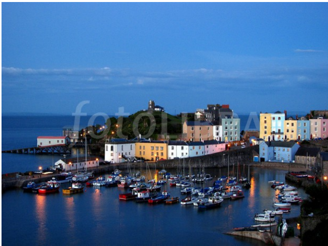
Tenby alta marea