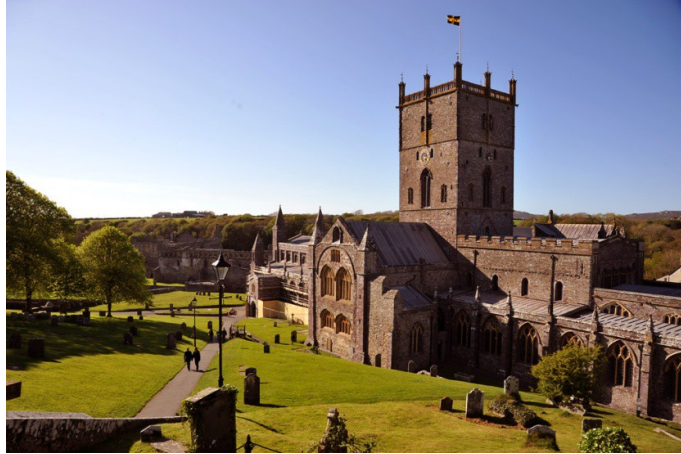
St. David's Cathedral