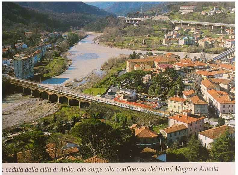
veduta della città di Aulla, che sorge alla confluenza dei fiumi Magra e Aulella