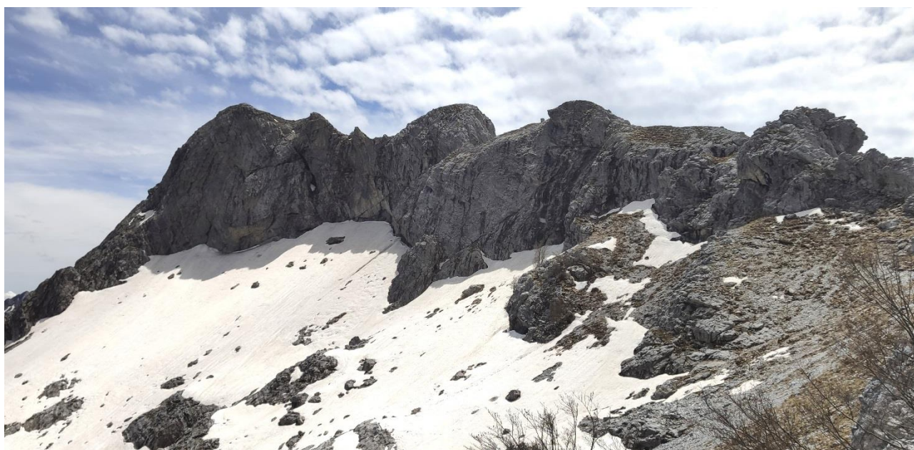
Vista da Val Serenaia del Monte Grondilice la vetta più alta a sx