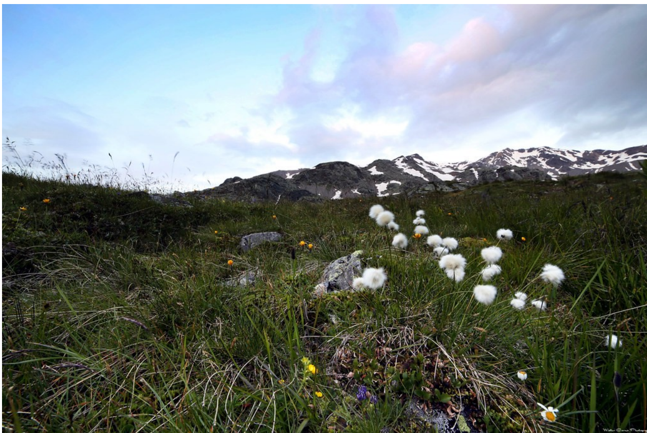
"VAL DI RABBI" BY WALTER.CORNO IS MARKED WITH CC BY-NC-SA 2.0.

Per prenotazioni ed informazioni contattare il Direttore di Escursione.