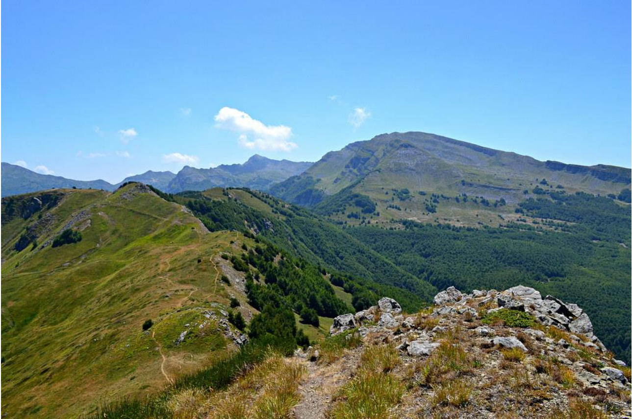
FOTO SCATTATA SUL MONTE NUDA, NELL'APPENNINO TOSCO-EMILIANO

DA Giulia van Pelt sotto licenza (CC BY-NC-ND 2.0)